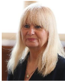
Iris Spranger, SPD Senatorin für Inneres und Sport