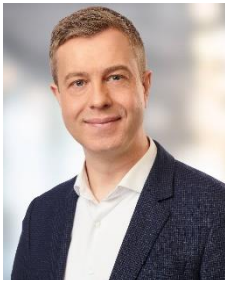
Stefan Evers, CDU Senator für Finanzen