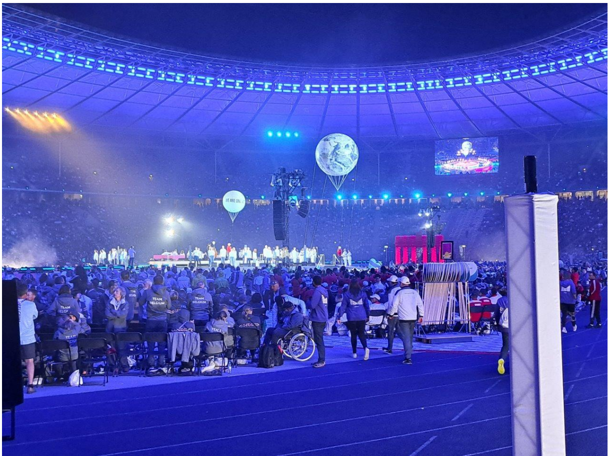
Eröffnungsfeier Special Olympics

Zum Beispiel Olympia und die Para-lympics. Oder die Fussball-europa-meisterschaft.