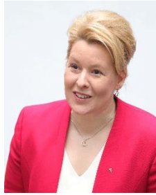
Franziska Giffey, SPD Stellvertretende Bürgermeisterin Senatorin für Wirtschaft, Energie und Betriebe