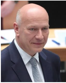
Kai Wegner, CDU Regierender Bürgermeister