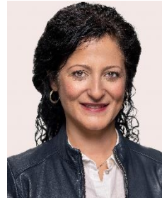
Cansel Kiziltepe, SPD Senatorin für Arbeit, Soziales, Gleichstellung, Integration, Vielfalt und Antidiskriminierung