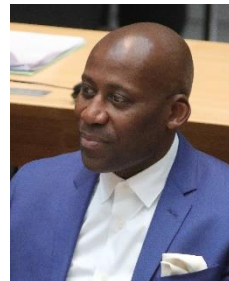
Joe Chialo, CDU Senator für Kultur und Gesellschaftlichen Zusammenhalt