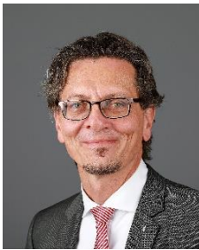
Christian Gaebler, SPD, Senator für Stadtentwicklung, Bauen und Wohnen