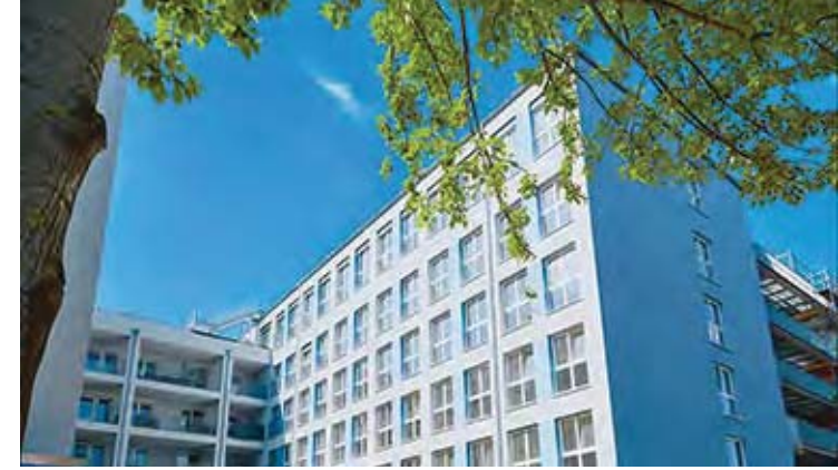
Seniorenwohnen Dr. Victor Aronstein in Lichtenberg | Foto: Paritätisches Seniorenwohnen gGmbH

Altenzentrum „Erfülltes Leben“ gGmbH. An dieser Gesellschaft hält der Paritätische Landesverband Berlin 40